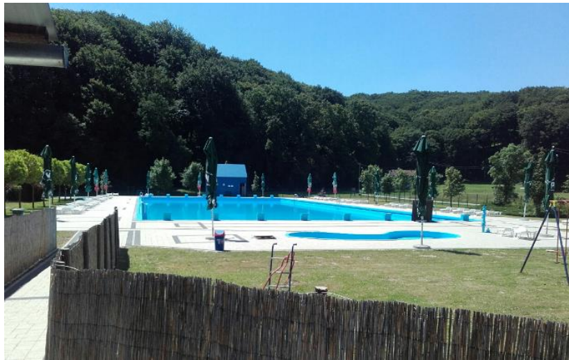
Slika 3. Bazen „Gradina“